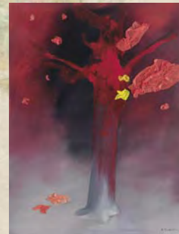
Κώστας Τσόκλης, χωρίς τίτλο, Ιανουάριος 2008, 70x100 εκ., γκαλερί Αστρολάβος