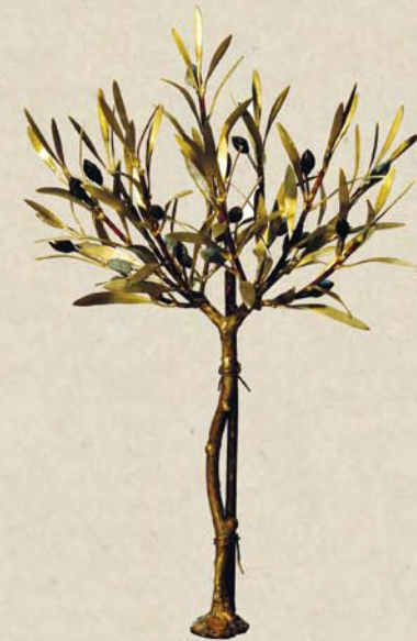
Έργο του Άγγελου Παναγιωτίδη