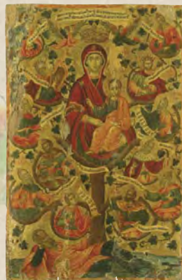
Θεόδωρος Πουλάκης, Παναγία, η Ρίζα Ιεσσαί, 1666, 70x107 εκ., Βυζαντινό και Χριστιανικό Μουσείο (αρ. 1575)

Μια εικονογραφική εκδοχή γενεαλογικού δέντρου είναι η Ρίζα του Ιεσσαί. Εμφανίζεται τον Μεσαίωνα, αρχικά στη Δύση, για να περάσει έπειτα στην Ανατολή, όπου γίνεται ιδιαίτερα δημοφιλής κατά τους μεταβυζαντινούς χρόνους. Η παράσταση αποδίδει συμβολικά την ανθρωπινή καταγωγή του Χριστού από τη βασιλική γενιά του Δαβίδ. Από το πλαγιασμένο σώμα του γενάρχη Ιεσσαί φύεται ένα δέντρο. Οι άρρενες πρόγονοι του Χριστού εικονίζονται στα κλαδιά να περιβάλλουν το πολύτιμο άνθος, την Παναγία με το Βρέφος. Η εικόνα δοξάζει τη θεία γένεση, ακριβώς όπως οι σίχιοι του ύμνου των Χριστουγέννων «Ράβδος εκ της ρίζης Ιεσσαί, και άνθος εξ αυτής, Χριστέ, εκ της Παρθένου ανεβλάστησας».