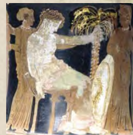
Παράσταση από αττικό ερυθρόμορφο αγγείο (πυξίδα), 340-330 π.Χ., ύψ. 26 εκ., Εθνικό Αρχαιολογικό Μουσείο (αρ. 1635)