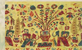
Παράσταση από νυφικό κεντητό σεντόνι από τα Ιωάννινα, όψιμος 18ος αιώνας, 120x30 εκ., Μουσείο Ελληνικής Λαϊκής Τέχνης (αρ. 3386)